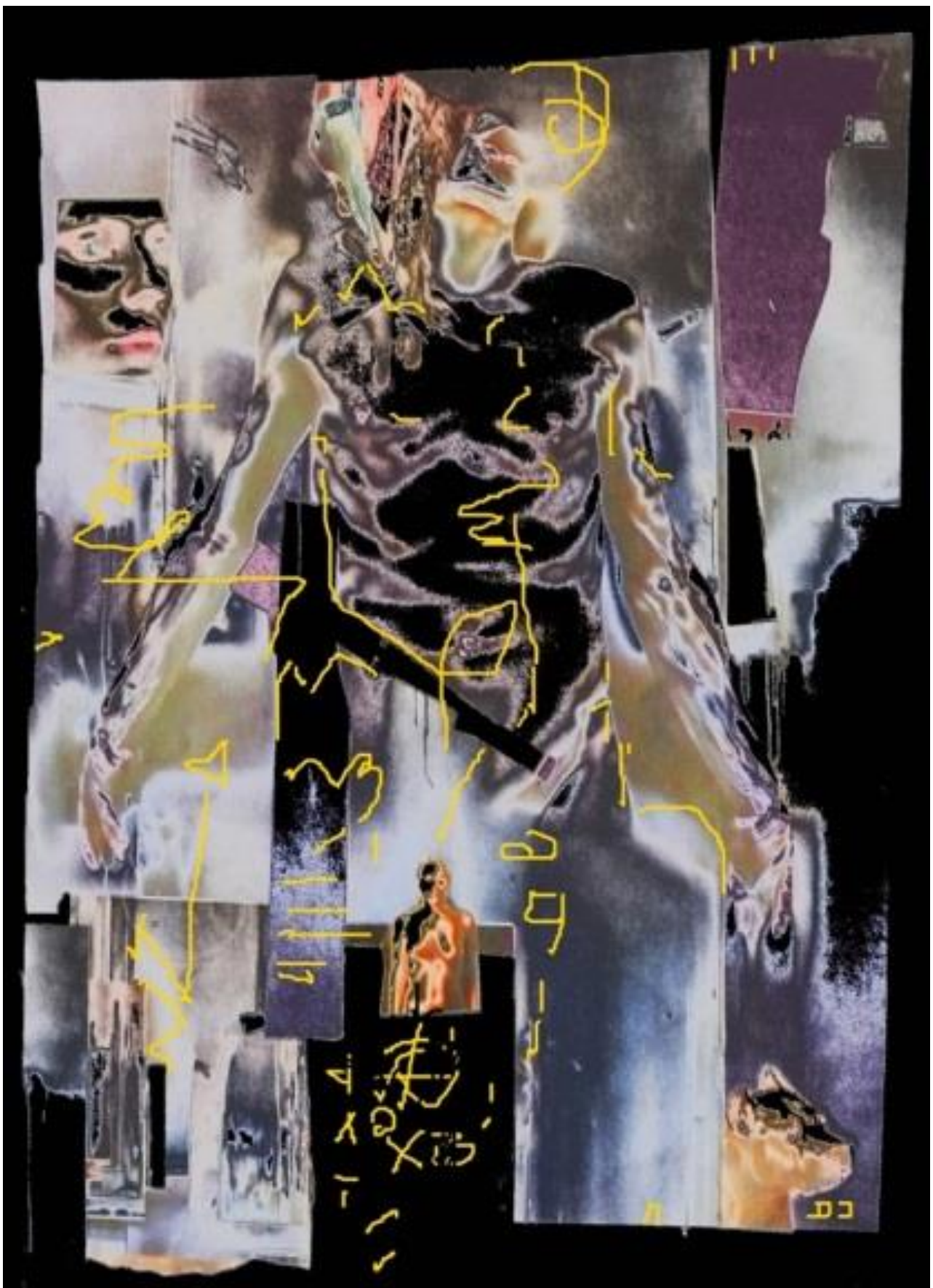
SÁNDORFI PARAFRÁZIS 2014, elektrografika, 70x50 cm