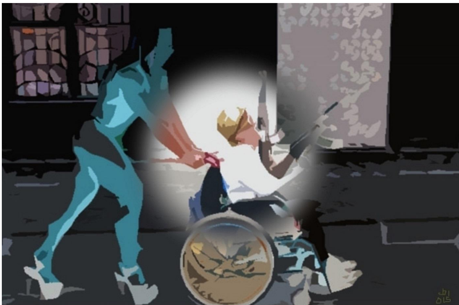
AZ ÉLET FINTORA 2015, elektrografika, 50x70 cm