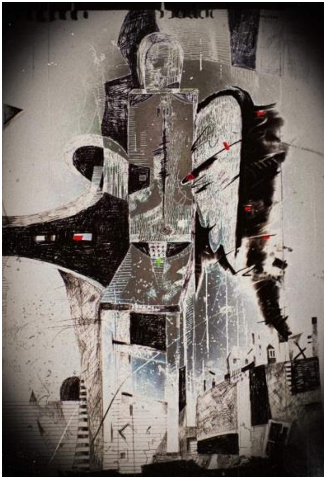
ANGYALVARÁZS 2017, elektrografika, 70x50 cm