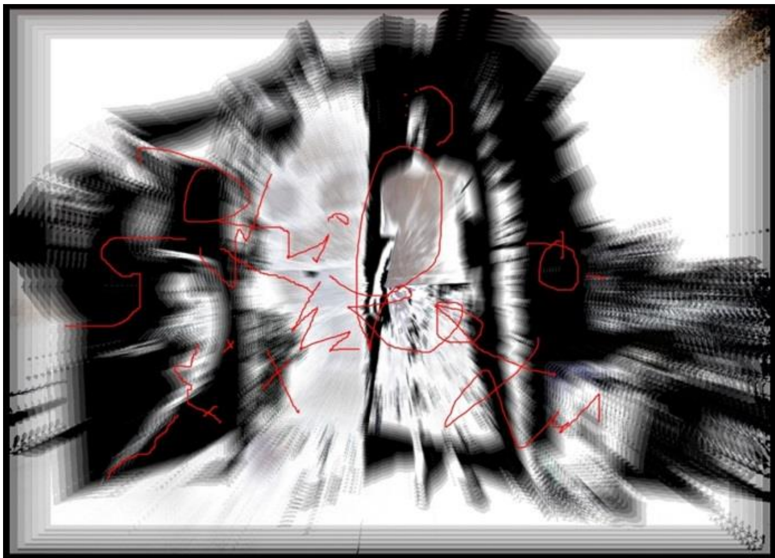
ETIÓP ÁLOM 2012, elektrografika, 50x70 cm