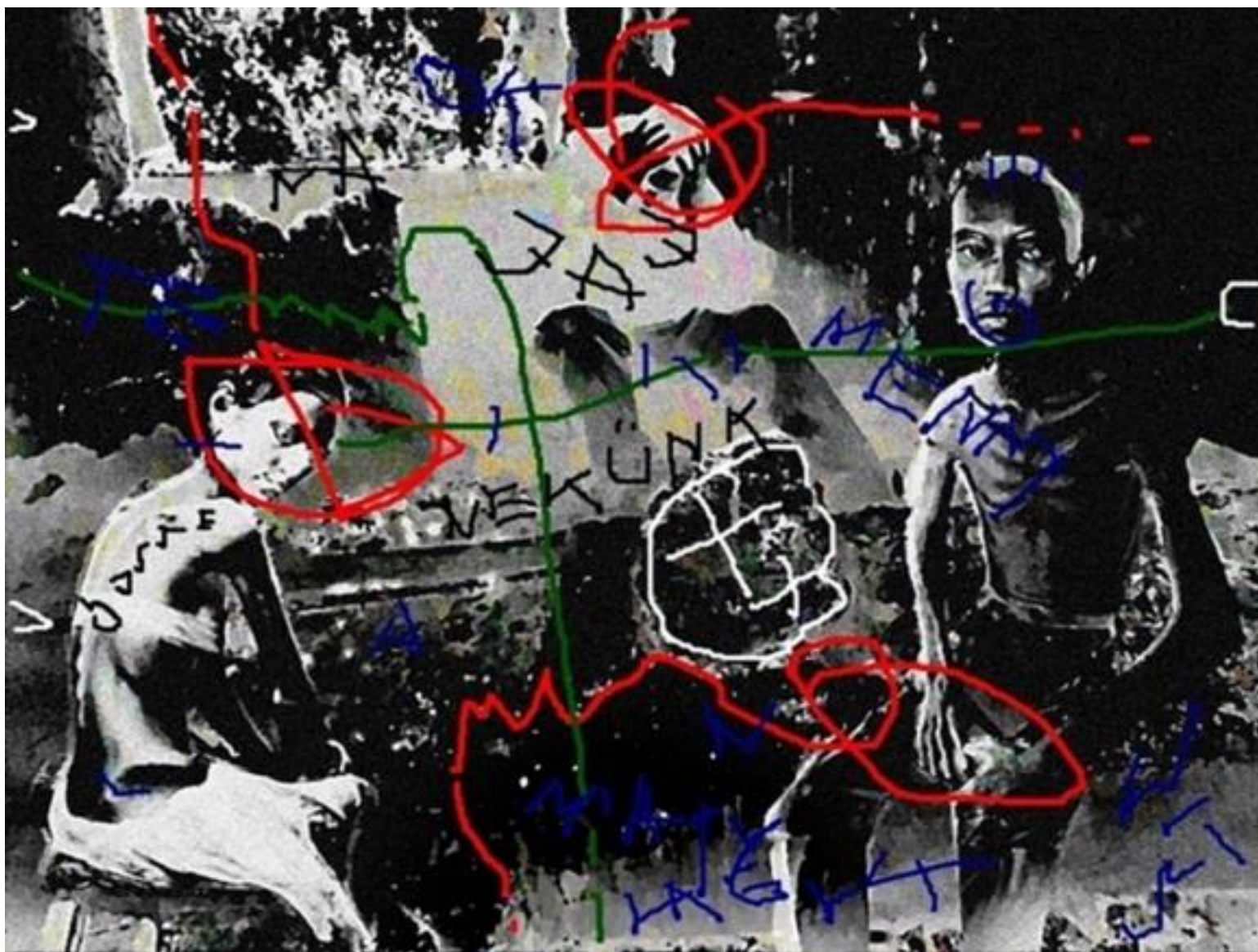
HOVÁ JUT ÍGY EZ A VILÁG 2011, elektrografika, 50x70 cm